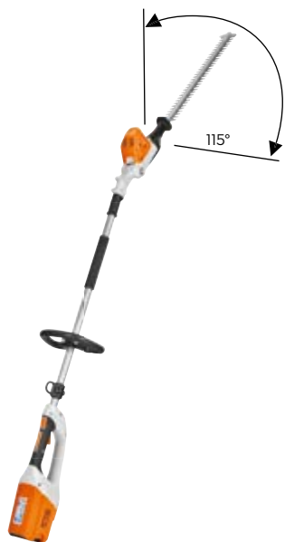
HLA 65 OHNE AKKU UND LADEGERÄT