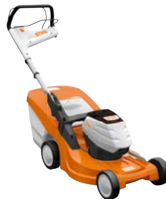
RMA 448 PC OHNE AKKU UND LADEGERÄT